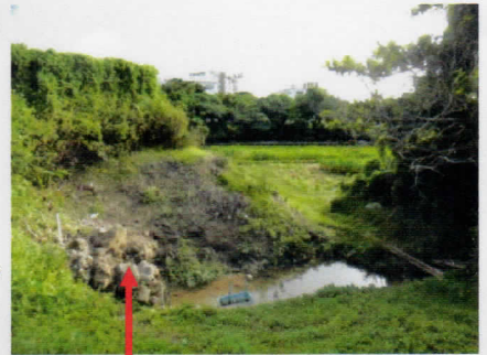
【田イモ畑に入る手前の石積み】

帰宅後、自宅にて保護者が危険に感じ警察に連絡し、現場を確認。周囲に同じようなものがないか調査したが見当たらなかったとのこと。