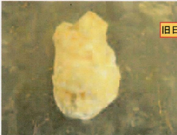
旧日本製手榴弾 (97式)