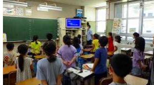
3年生の誓いの言葉(3-2)

今朝は、オンデマンドにて、全校での平和集会を行いました。平和に向けた各学年の誓いの言葉を心を込めて発表し、「月桃」を歌いました。