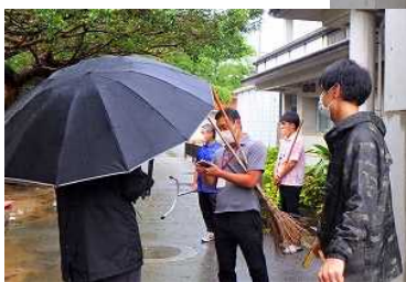
警察が到着・確保 進入した学級の子供たちも無事。他の児童もしっかり安全確保できました