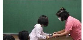
タブレット端末貸与式