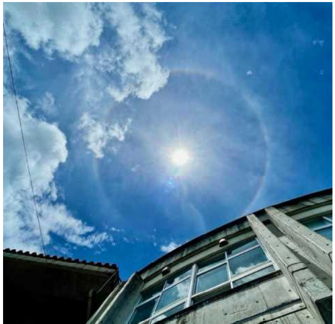
2022/7/6(水) 13:44 宜野湾市立大謝名小にて撮影