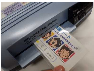
シートのわからはさむ