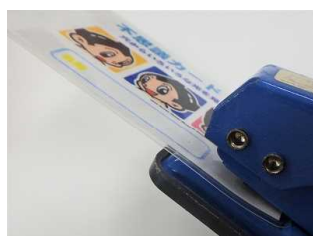
フィルムの数の分開ける