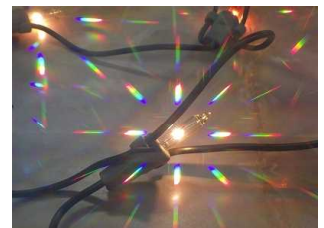
分光シートで虹が見える