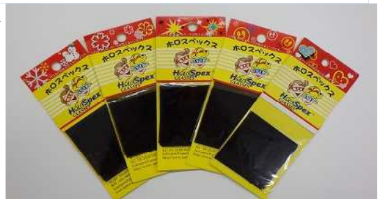
ホロスペックスフィルム

わたしたちの身の回りには、いろいろな光があふれています。そこで、今日は光の変身ショーを楽しんでみましょう。分光シートやホロスペックスフィルムを貼った穴から、いろいろな光（信号やアパートの灯りなどの夜景や花火など）を見てみましょう。光がいろいろな形に見えますよ。