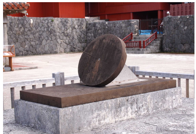
首里城にある日影台（9月17日）