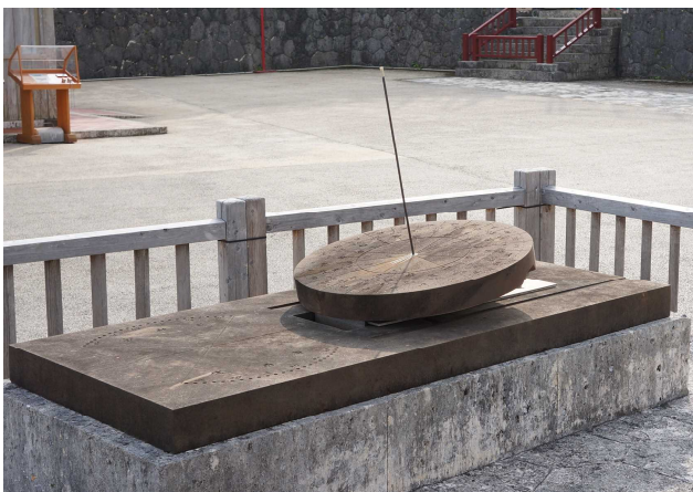
首里城にある日影台（1月2日）