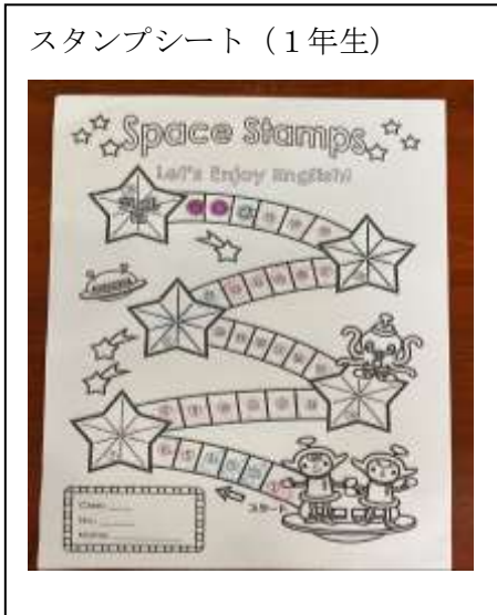
スタンプシート（1年生）