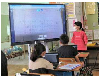
全体を求めて人数でわる