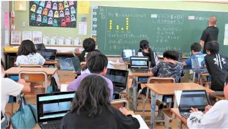
タブレットで考えを比べ合い、みんなでまとめ