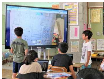
多い方から少ない方へ

平均(へいきん)は、「ならす」ということを知り、どのようにしたら、平均を求めることができるかを学んでいました。晋先生と5年1組一人一人の学ぶ姿勢や意欲が見られました。