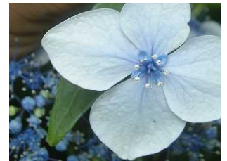
ガクアジサイの装飾花