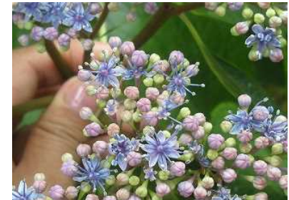
ガクアジサイの両生花