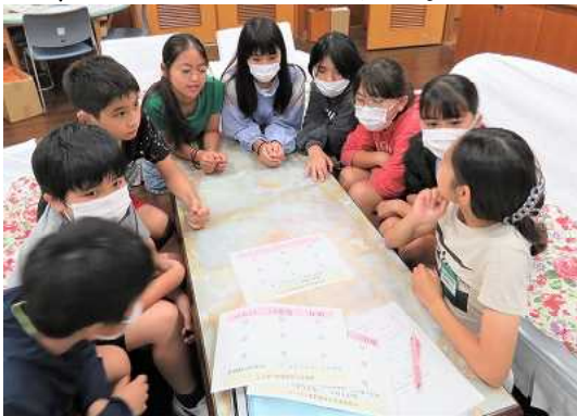
校長室で話合う児童会委員