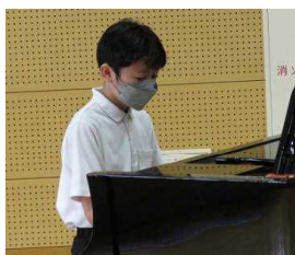
校歌伴奏 6年 だんさん