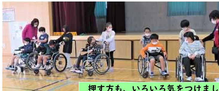
押す方も、いろいろ気をつけました