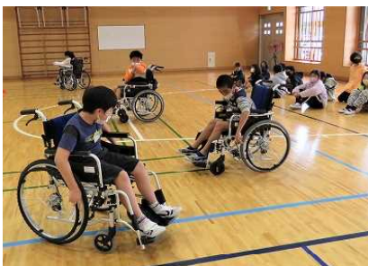
ちゃんと元の所に帰れた！