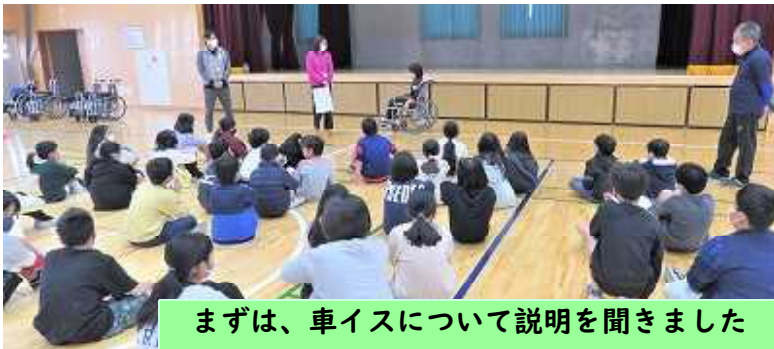
まずは、車イスについて説明を聞きました

今日、4年生が「総合的な学習の時間（福祉）」の一環として、車イス体験をしました。宜野湾市社会福祉協議会の方々のサポートを受けて、車イスの乗り方や注意事項を確認してから、実際に体験しました。車イスに乗って自分で移動する体験や、車イスに乗り、押しってもらう体験、友達の乗った車イスを押し体験の3つを行いました。最初は難しかったけど、だんだん慣れてきて、上手になっていきましたが、体育館のような平らなゆかでないところは難しいだろうなどの声もありました。車イスのよさも大変さも感じたひとときでした。