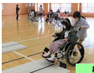
段差のある所は難しい！