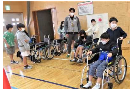
乗る方も、最初はドキドキ