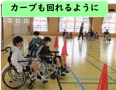
カーブも回れるように