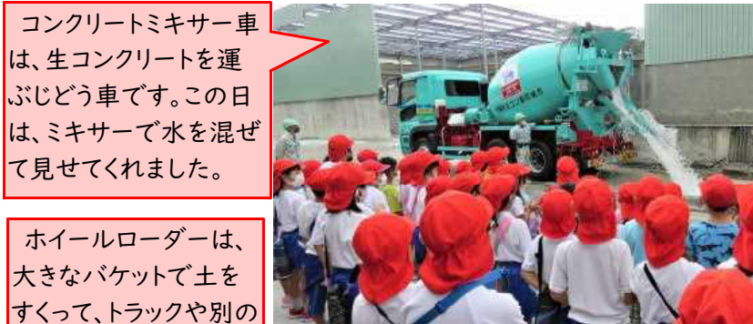
コンクリートミキサー車は、生コンクリートを運ぶじどう車です。この日は、ミキサーで水を混ぜて見せてくれました。